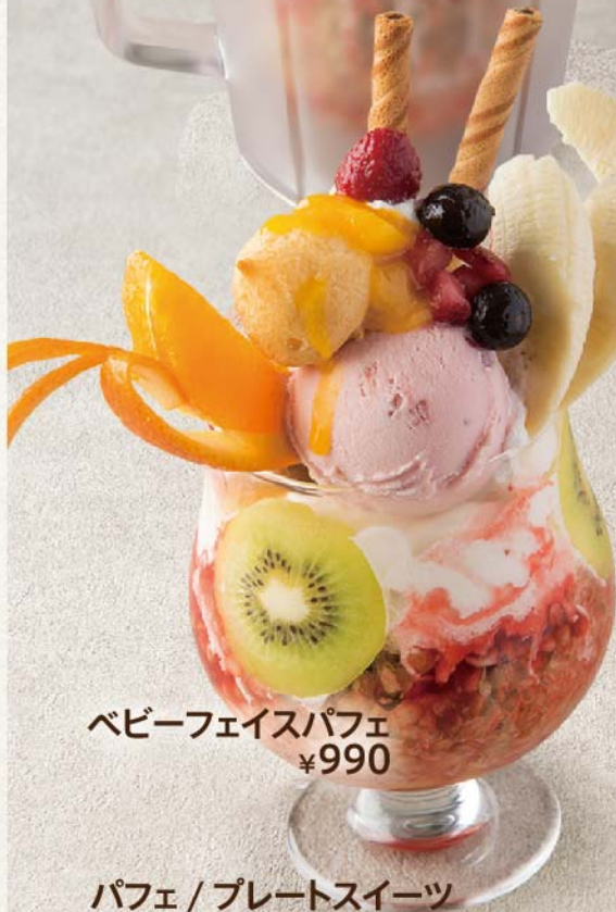
ベビーフェイスパフェ ¥990