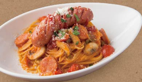
▶ みんなのソーセージナポリタン ¥880

大ぶりでプリプリのエビやムール貝など海の幸が贅沢に味わえる一皿。4種類のトマトを独自にブレンドしたフレッシュなトマトソースを引き立てるのは青森産のホタテからとった特製の出汁と、隠し味のサフラン。最後まで感じる海の恵みをお楽しみください。