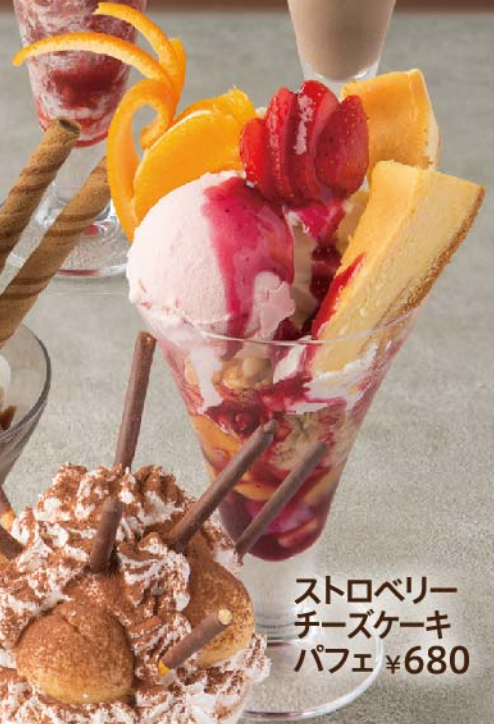
ストロベリー チーズケーキ パフェ ¥680