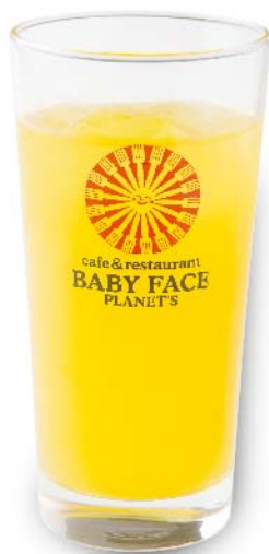
タンカン スカッシュ