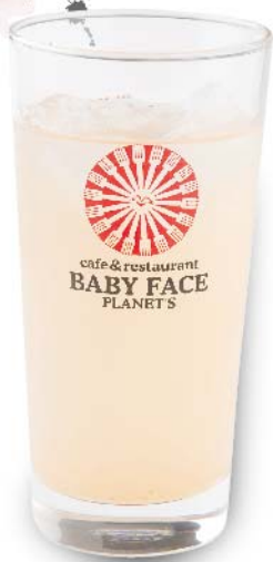
博多いちじく スカッシュ