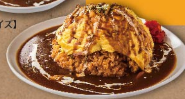
ふわふわ帽子のオムライス【相撲レスラー】