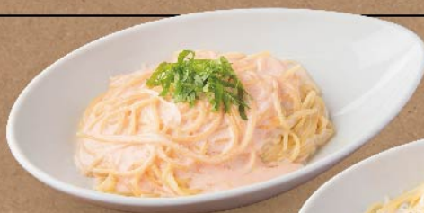
▶ 明太子クリーム ¥880