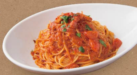
▶ ニンニクと唐辛子と完熟トマト ¥980