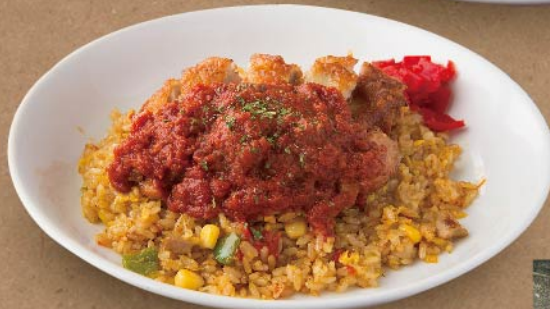
▶ スパイシーチキン ジャンバラヤ ¥1,080