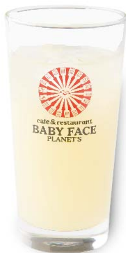
ばんかん 天草晩柑 スカッシュ