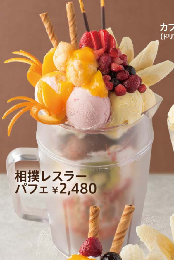
相撲レスラー パフェ ¥2,480

カフェミルクパフェ (ドリンクパフェ) ¥680 イチゴミルクパフェ (ドリンクパフェ) ¥680 チョコレートミルクパフェ (ドリンクパフェ) ¥680