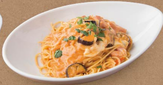
▶ ナスとモッツァレラのトマトクリーム ¥780