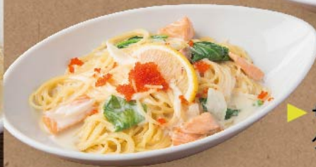
▶ サーモンとほうれん草のクリーム ¥980