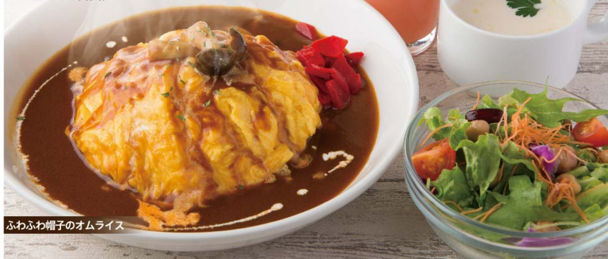
ふわふわ帽子のオムライス