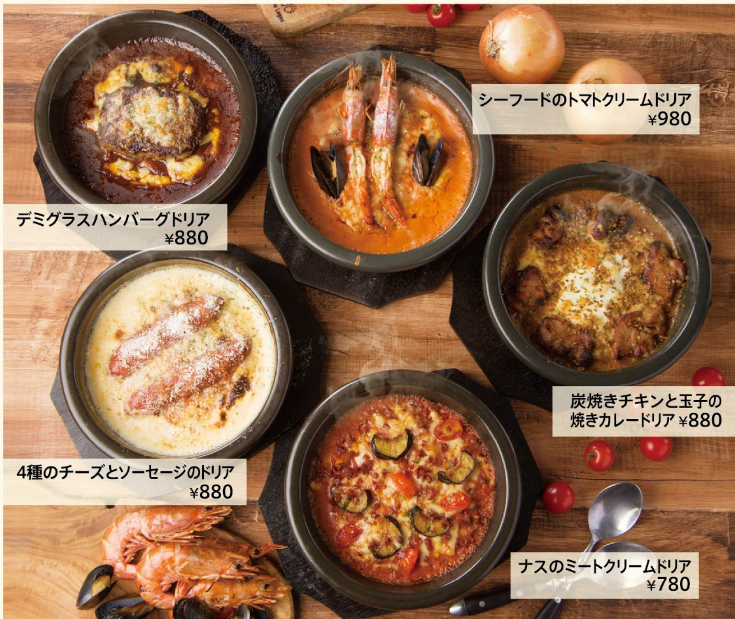
デミグラスハンバーグドリア ¥880