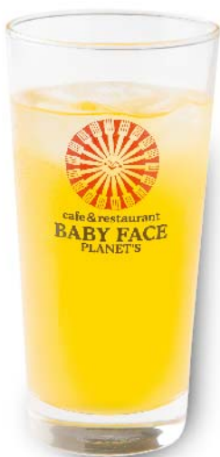
うんしゅう 温州みかん スカッシュ