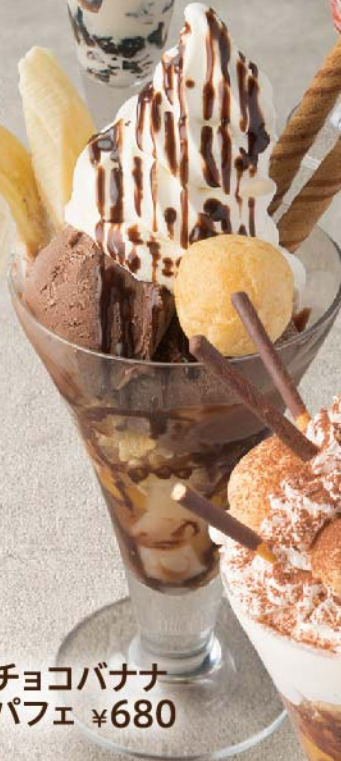
チョコバナナ パフェ ¥680