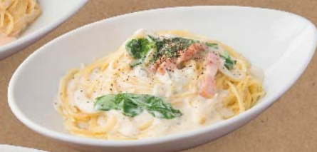
100 ゴルゴンゾーラクリーム ¥1,080