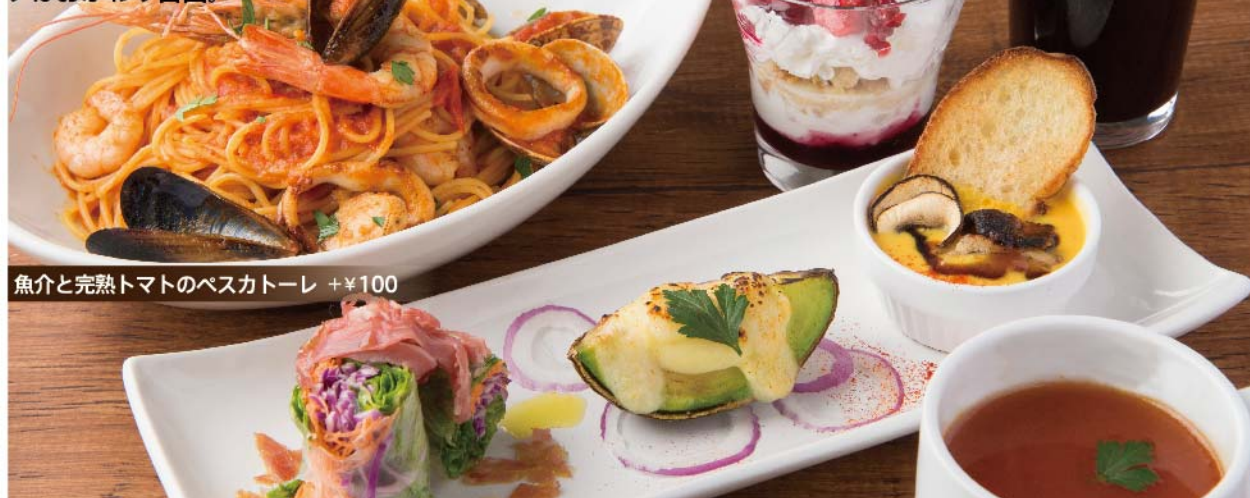
魚介と完熟トマトのペスカトーレ +¥100