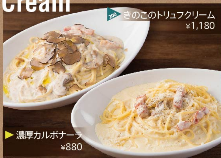
200 きのこのトリュフクリーム ¥1,180