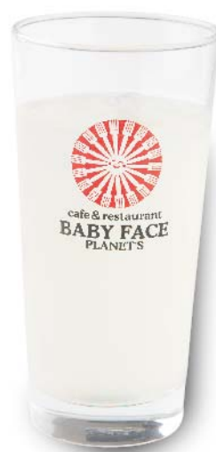
かぼす& 柚子スカッシュ