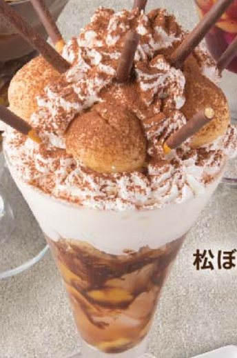
松ぼっくりパフェ ¥680