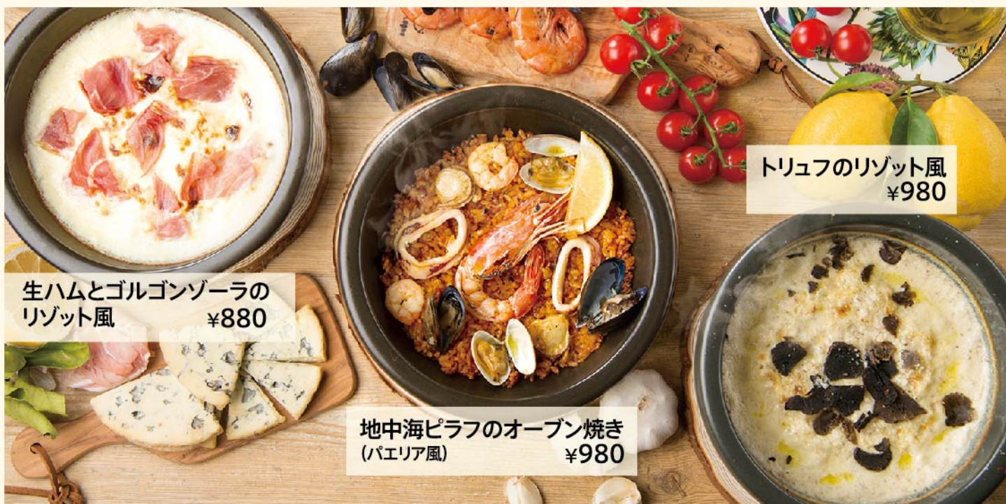
生ハムとゴルゴンゾーラの リゾット風 ¥880