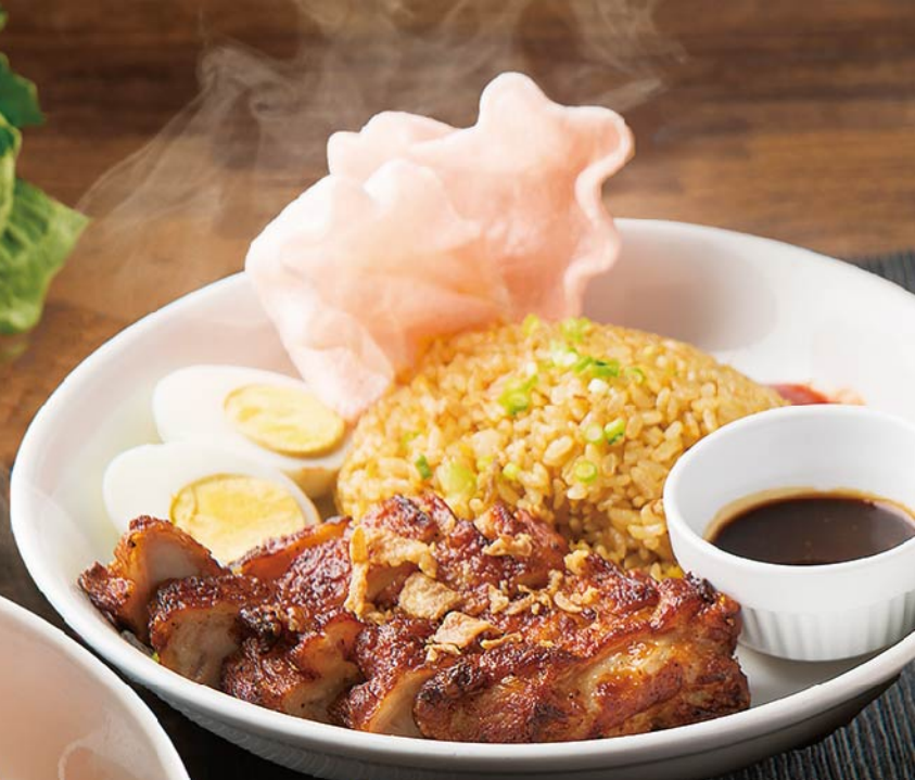
▶ シンガポールチキンピラフ ¥980